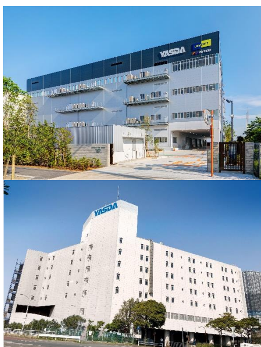
東京メディカルロジスティクスセンター 東雲営業所（上）、（仮称）辰巳営業所（下）

ーメディカルロジスティクスセンターを開設し「医療機器総合ワンストップサービス」を提供ー