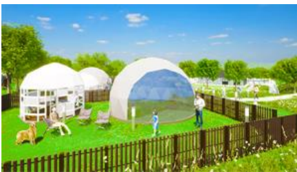
宿泊棟外観パースイメージ