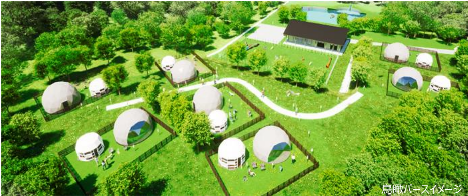
鳥瞰パースイメージ

株式会社エイチ・アイ・エス（本社：東京都港区 以下、HIS）は、北陸初となる、愛犬と一緒に過ごす専用のグランピング施設「GLAMHIDE WITH DOG KOMATSU」（読み方：グランハイド ウィズ ドッグ コマツ）を7月25日（月）よりソフトオープンし、本日より予約受付を開始します。HISがグランピング施設を運営するのは初となります。