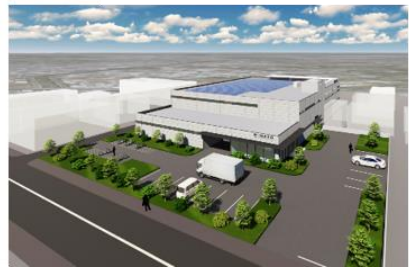
ミナト・アドバンスト・テクノロジーズ株式会社の新社屋完成イメージ図