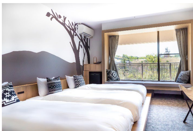
客室（ネイチャールーム）