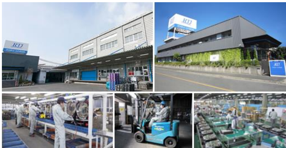
培ったリユース・リサイクル技術を通し、将来の地球環境を護り、循環型社会を創造することをミッションとして活動しています。

(リサイクルテック・ジャパン: https://www.r-t-j.co.jp/corporate/ir.html )