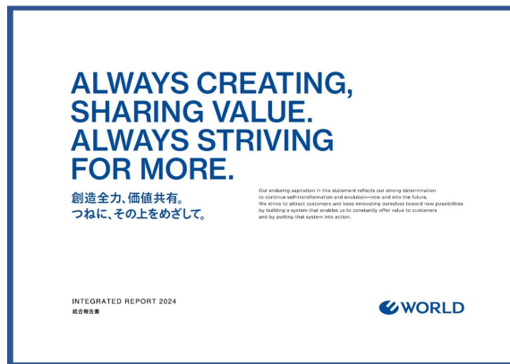
表紙は初回の統合報告書として、ワールドのコーポレートステートメントを力強く伝えるデザイン

統合報告書は、ワールド コーポレートサイト ( https://corp.world.co.jp/ ) にてダウンロード可能です。ワールドは今後も定期的に統合報告書を発行し、透明性のある情報提供を継続していく所存です。持続可能な社会の実現に向けて一層努力し、全てのステークホルダーの皆様にとって価値ある企業であり続けることを目指してまいります。 ※英語版は追って年内公開予定です。