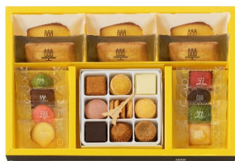
⑤プティ・タ・プティ・ アソート Sボックス