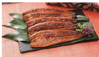
②うなぎ蒲焼5尾セット