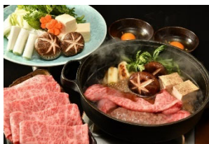
⑤松阪牛すき焼き用