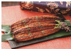
②うなぎ蒲焼 2 尾セット