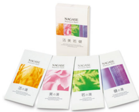
① ナガセ プレミアム バス

※寄付は、個人名では行いません。お申し出いただいた件数・金額を集計し、当社が一括して寄付いたします。