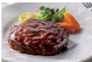
①デミグラスハンバーグ

※寄付は、個人名では行いません。お申し出いただいた件数・金額を集計し、当社が一括して寄付いたします。