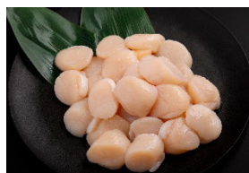
③北海道産 お刺身用 帆立貝柱