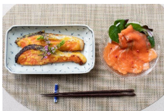
②スモークサーモン・ 漬け魚詰合せ