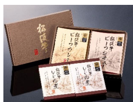
⑤松坂牛よくばりセット