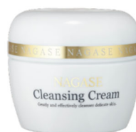
⑪クレンジングクリーム