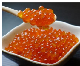
⑨北海道産 いくら醤油漬