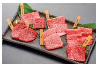
⑥米沢牛焼肉食べ比べセット