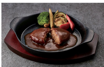
①じっくり煮込んだ デミグラスハンバーグ

※寄付は、個人名では行いません。お申し出いただいた件数・金額を集計し、当社が一括して寄付いたします。