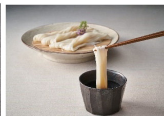
④稲庭うどん、 比内地鶏つゆ詰合せ