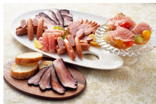
⑥農家のベーコンセット