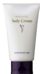
⑥ナガセビューティケア ボディクリーム