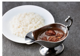
③スパイス香る 牛すじカレー