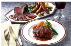
①ローストビーフ・ハンバーグ・ウインナーセット

※寄付は、個人名では行いません。お申し出いただいた件数・金額を集計し、当社が一括して寄付いたします。