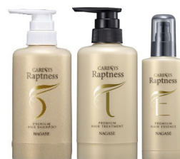
⑪ナガセ ヘアケアセット