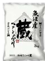
⑦魚沼産コシヒカリ蔵