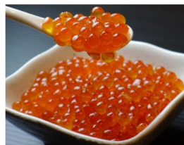
③北海道産いくら醤油漬