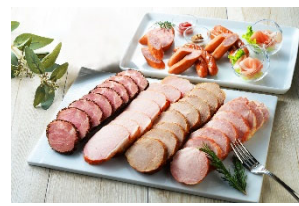
⑧ハム・ウインナーセット